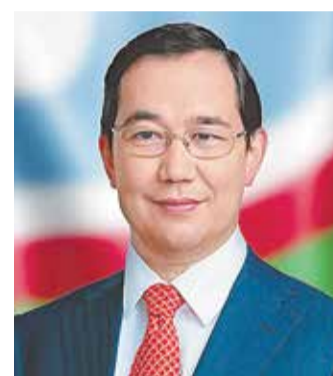
Айсен НИКОЛАЕВ, глава Республики Саха (Якутия):

Уважаемые работники и ветераны строительного комплекса! Мы благодарны и признательны за ваш профессионализм, ежедневный труд, который стоит за каждым строительным проектом в нашей республике, будь то социальные учреждения или крупные инфраструктурные объекты.