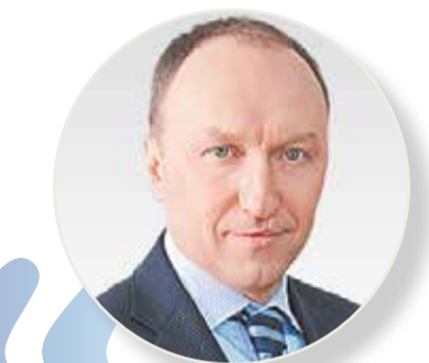
Андрей БОЧКАРЕВ, заместитель мэра Москвы по вопросам градостроительной политики и строительства

В настоящее время мы продолжаем работу. Так, сейчас в рамках создания маршрутов МЦД-3 и МЦД-4 ведутся масштабные строительные работы по реконструкции железнодорожных путей и пассажирских платформ на Киевском направлении, на участке от Звенигородского шоссе до Савеловского вокзала, от Марьиной Рощи до Площади трех вокзалов, от Площади трех вокзалов до Нижегородской; продолжаются работы по строительству соединительной ветви между Киевским и Смоленским направлениями, по реконструкции Митяевской соединительной ветви между Октябрьской железной дорогой и Казанским направлением Московской, а также на других объектах. Напомним, что всего за несколько лет на маршрутах МЦД было построено 12 новых станций и реконструировано 23 существующих остановочных пункта. По нашим планам, запуск маршрутов МЦД-3 и МЦД-4 планируется до конца следующего года.