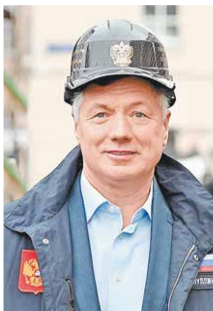
Марат ХУСНУЛИН, заместитель председателя правительства РФ:

Дорогие коллеги! Поздравляю вас с наступающим 2023 годом!