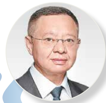
Ирек ФАЙЗУЛЛИН, министр строительства и ЖКХ РФ

Без сплоченности и постоянного взаимодействия всех участников строительного процесса мы не добились бы таких результатов