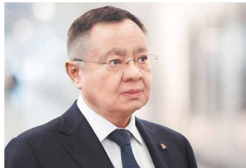
Ирек ФАЙЗУЛЛИН, министр строительства и ЖКХ РФ

В этом году мы старались не только сохранить результаты прошлого года, но и превзойти их, несмотря на то, что у министерства появились новые направления работы и все мы работаем в новых условиях