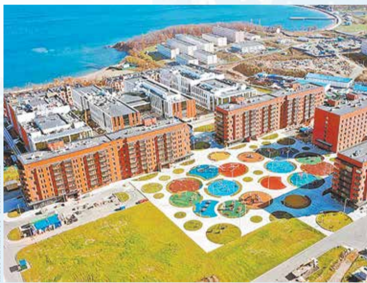
ПРЕСС-СЛУЖБА ООО «СТРОЙТРАНСГАЗ»

На острове Русском завершено строительство учебной части уникального учебно-образовательного комплекса, включающего в себя филиалы Московской государственной академии хореографии и Центральной музыкальной школы при Московской консерватории имени П. И. Чайковского, а также жилье для преподавателей и гастролирующих артистов. Крупный культурно-образовательный кластер возводился во Владивостоке с 2019 года на двух площадках: на Русском острове и на высочайшей точке исторической части столицы Приморского края — сопке Орлиное гнездо.